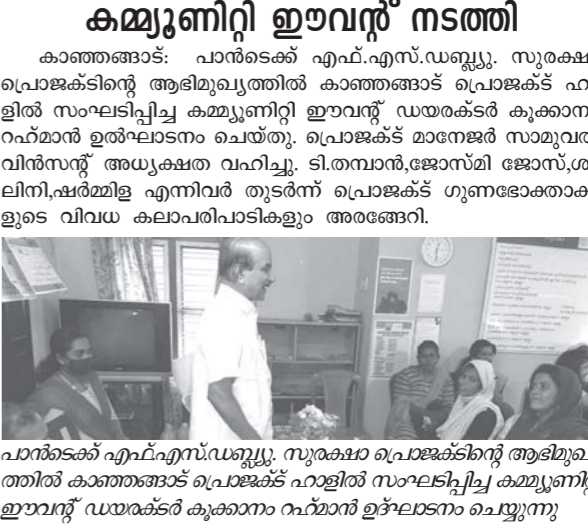
പാൻസെട് എഫ്.എസ്.ഡബ്ല്യു. സുരക്ഷാ വലയങ്ങൾക്കു ആഭിമുഖ്യത്തിൽ കാഞ്ഞങ്ങട പ്രഭാജിക്ക് ഹാളിൽ സംഘടിപ്പിച്ച കമ്മ്യൂണിറ്റി ഊവാൻ ഡയർക്ടർ ക്യാമ്പും റൂന്മാൻ ഉദ്ഘാടനം ചെയ്യുന്നു