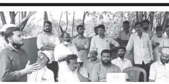
ചെർക്കള - കല്ലടക്കു റോഡിന്റെ ശോചനീയാവസ്ഥ പരിഹരിക്കണമെന്ന് ആവശ്യപ്പെട്ട കൊണ്ട് ജനകീയ സമര സമിതിയുടെ നേതൃത്വത്തിൽ നടത്തിയ പ്രകടനം

സാമ്പത്തിക നഷ്ടം നേടിക്കൊണ്ടിരിക്കുന്ന സിനിമാലോകം അടിച്ചു താണ്. എന്നാൽ കോവിഡ് നിയന്ത്രണങ്ങളിൽ ഇളവില്ലെന്ന നിലപാടാണ് സ്വീകരിച്ചത്.