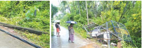
കോയിപ്പാടി കടപ്പുറത്തു തെങ്ങു കടവുഴകിവിന്ന് വൈദ്യുതിപോസ്റ്റുകളും ട്രാൻസ്മിറ്ററും തകരാറായ നിലയിൽ

കുന്ദള: കോയിപ്പാടി കടപ്പുറത്ത് ഇന്നു പുലർച്ചയുണ്ടായ ശക്തമായ കാറ്റിൽ തെങ്ങു കടവുഴകിവിന്ന് അഞ്ചുവൈദ്യുതി പോസ്റ്റുകൾ തകർന്നു. ട്രാൻസ്മിറ്ററുമായി കേടുപാടുകളായിട്ടുണ്ടോ എന്നു പരിശോ