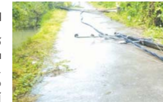
കോയിപ്പാടി കടപ്പുറത്തു തെങ്ങു കടവുഴകിവിന്ന് വൈദ്യുതിപോസ്റ്റുകളും ട്രാൻസ്മിറ്ററും തകരാറായ നിലയിൽ

തീരു: കനത്ത മഴയെ തുടർന്ന് ഇടുക്കി അണക്കെട്ടിലെ ജലനിരപ്പ് 2390 അടിയിലേക്ക് നിലവിലെ ചട്ട പ്രകാരം അണക്കെട്ടിൽ നില നിർത്താവുന്ന പരമാവധി ജലനിരപ്പ് 2398.86 അടിയാണ്. എട്ടടി കൂടി ജലനിരപ്പ് ഉയർന്നാൽ അണക്കെട്ട് തുറന്നു വിടേണ്ടി വരും. ഇത്തരമൊരു സാഹചര്യത്തിൽ അതീവ ജാഗ്രതയ്ക്കു സാധിക്കാൻ പദ്ധതിയിടുന്നതിനാണ് സർക്കാർ അധികൃതരുടെ തീരുമാനം. ഇടുക്കി ഡാം ഉൾപ്പെടുന്ന മേഖലയിൽ രണ്ടു ദിവസമായി കനത്ത മഴ തുടരുകയാണ്. ഇന്നലെ മാത്രം 51.8 മില്ലി മീറ്റർ മഴയാണ് ലഭിച്ചത്. 27.84 ദശലക്ഷം യൂണിറ്റ് വൈദ്യുതി ഉൽപ്പാദിപ്പിക്കാനുള്ള വെള്ളമാണ് ഒഴുകിയെത്തിയത്. എന്താൽ 10.27 ദശലക്ഷം യൂണിറ്റ്