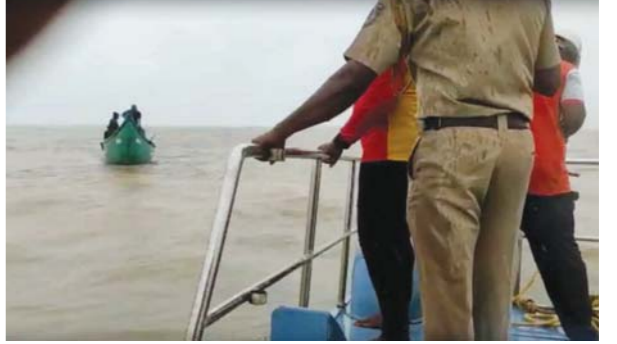
മഞ്ചേലിൽ കടലിൽ കുടുങ്ങിയ മത്സ്യത്തൊഴിലാളികളെ തീരദേശ പോലീസ് രക്ഷപ്പെടുത്തുന്നു.